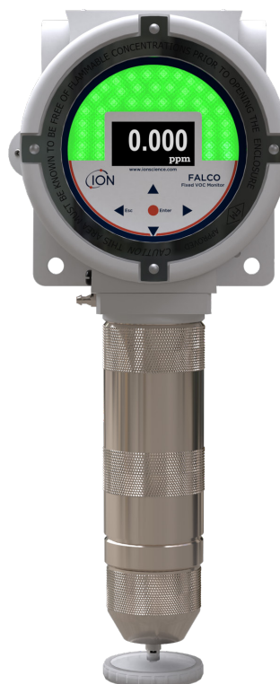
Modelo bombeado de 10,6 eV

Registre su producto en línea en el plazo de un mes tras su compra para aumentar su garantía. Visite ION Science.